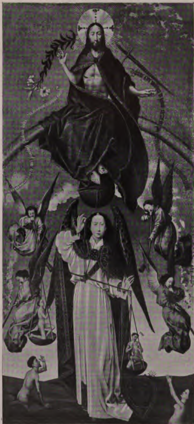
Retable de l'hospice de Beaune. Panneau central d'après un dessin de M. Abel Jamas.